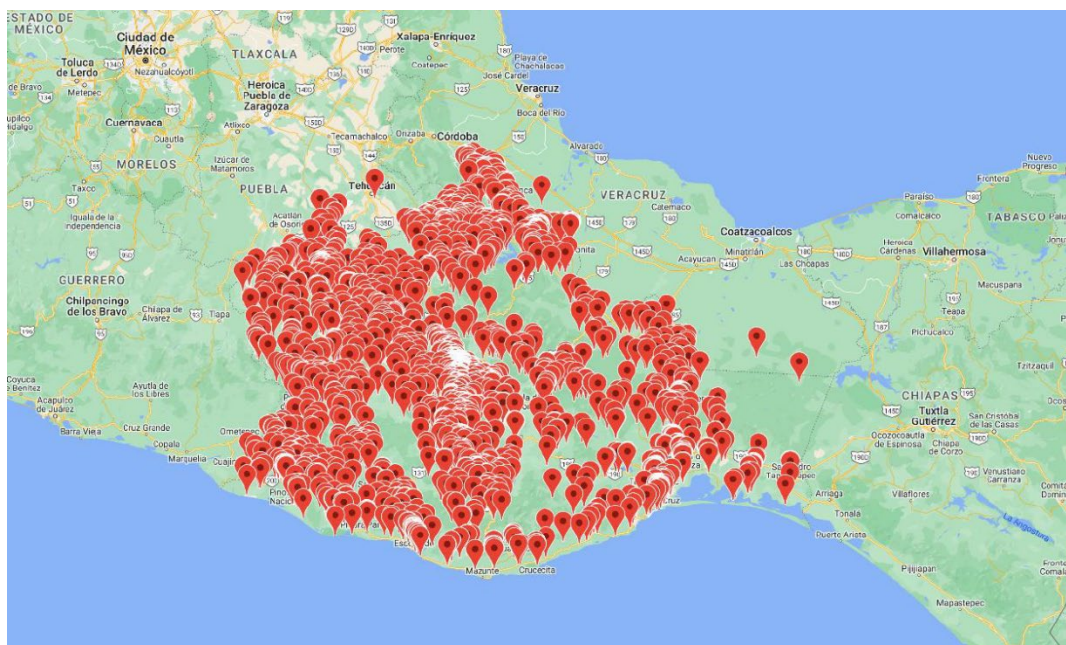
Mapa de geolocalización de las actas recibidas mediante PREP Casilla por parte de las y los CAE's.