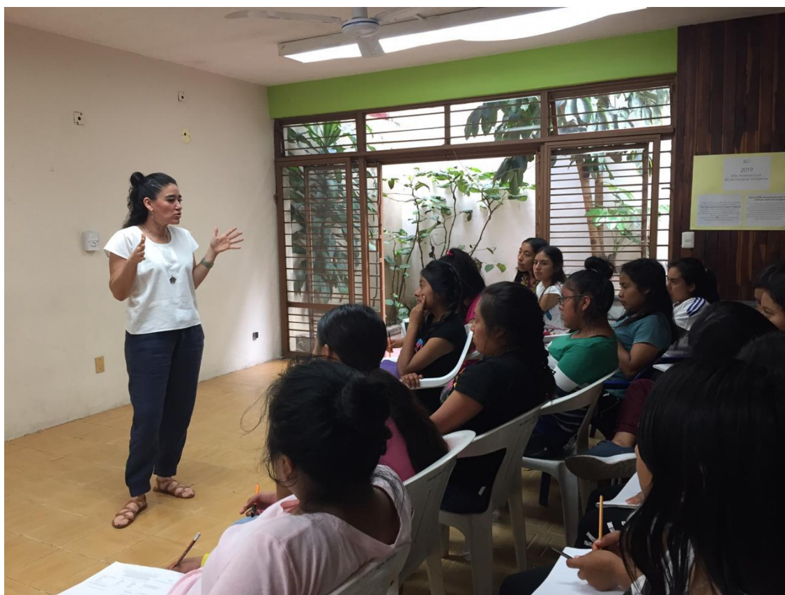
Participantes del taller