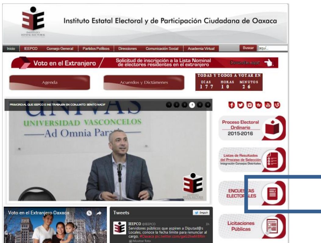
Imagen del botón sobre encuestas electorales publicadas

Imagen del sitio oficial con el apartado de encuestas electorales publicadas