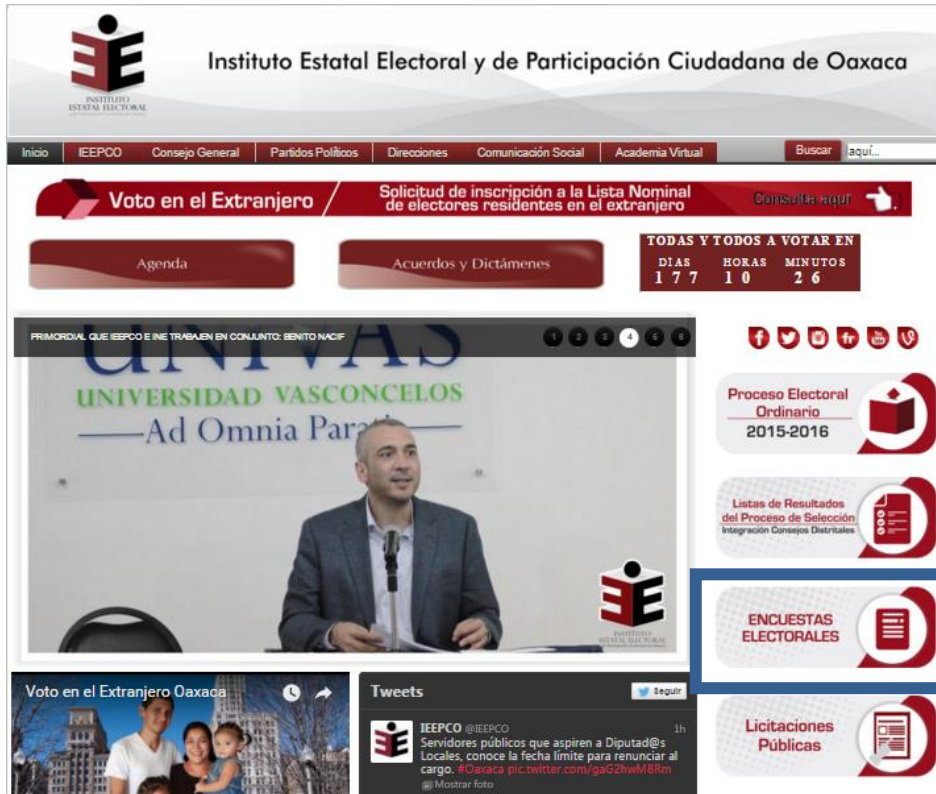
Imagen del botón sobre encuestas electorales publicadas